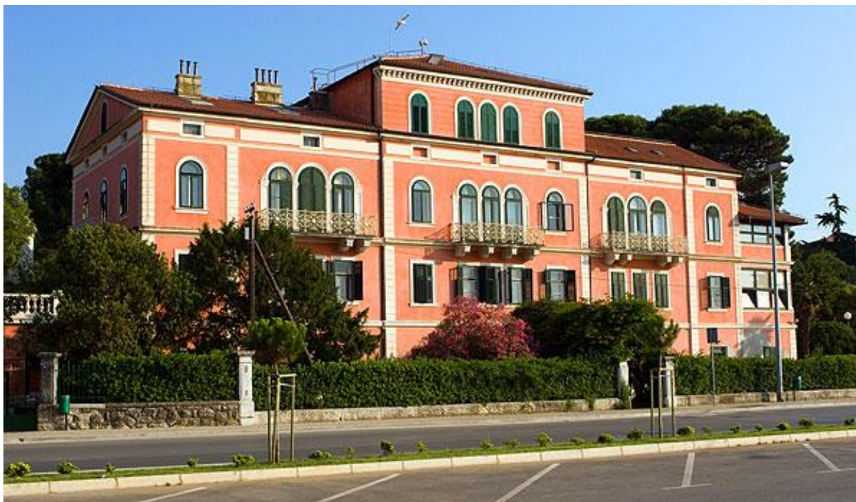
Institut »Ruđer Bošković«, Centar za istraživanje mora Rovinj